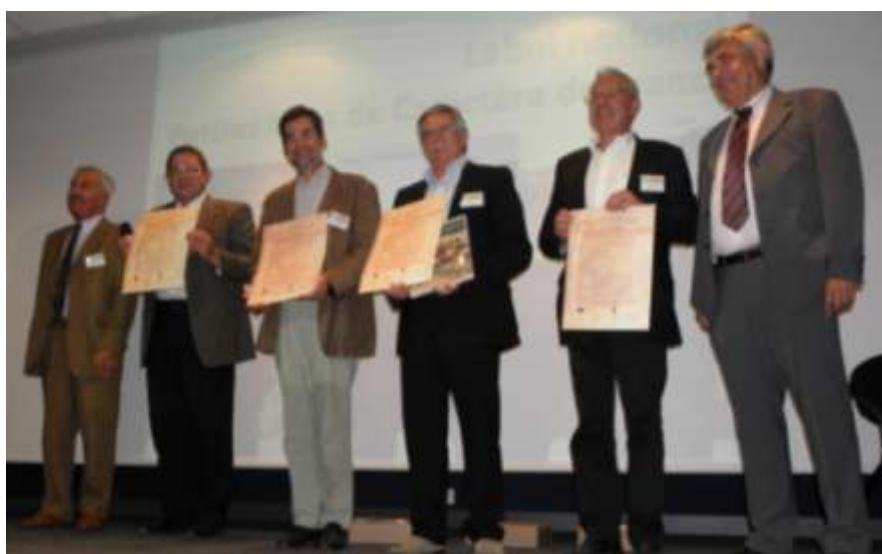
Signature de la Charte de Qualité

Signée officiellement par quatre partenaires le 26 juin 2009, elle concerne aujourd'hui d'autres Réseaux Territoriaux régionaux ou départementaux qui se structurent afin de rejoindre l'association « Petites Cités de Caractère® » de France.