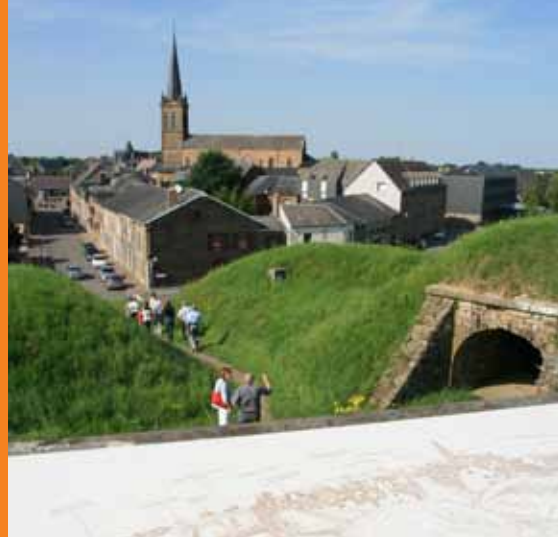
La cité en étoile