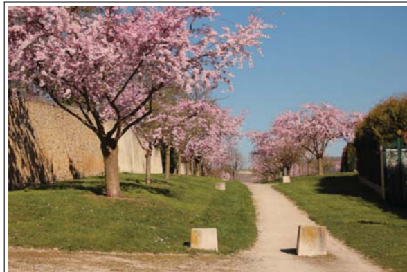
Verger du Quartier Saint-Pierre