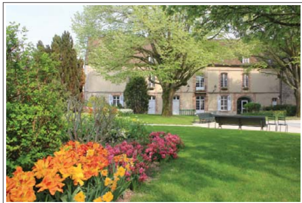
Jardin de l'Hôtel de Ville