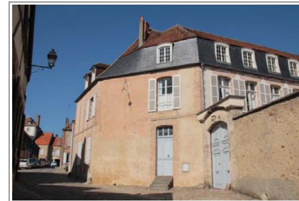
Cadran Solaire - rue de la Juiverie

Office de Tourisme de Sézanne et sa Région