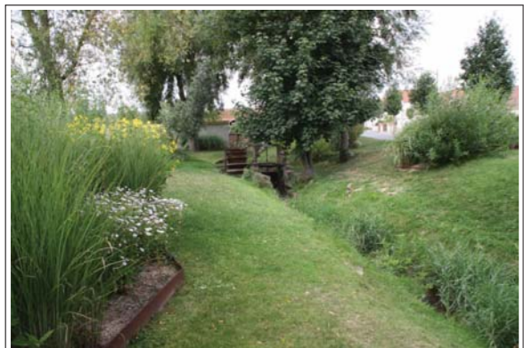
Domaine des Saules