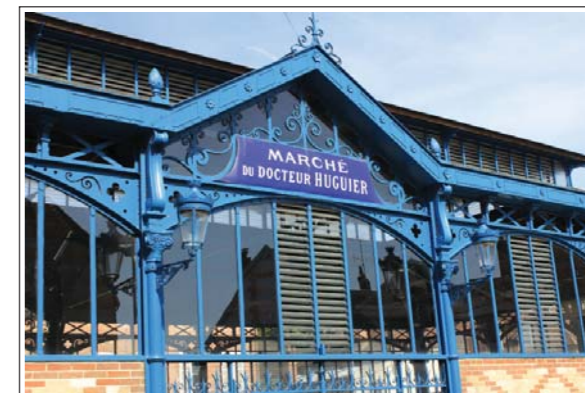
Halle du Dr Hugulier