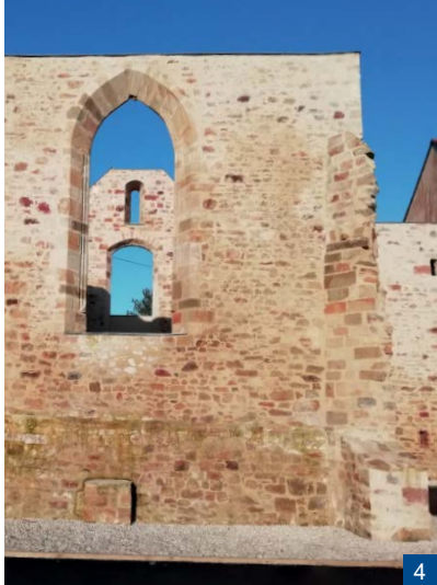
3. La sculpture rue des Chapelles / 4. Le prieuré

En 1206, Guillaume III érige la chapelle en collégiale et la confie à des chanoines. Un enfeu en arcade abrite son gisant dans le mur nord du chœur, derrière l'autel. L'église actuelle, de vastes proportions, est reconstruite au début du XVI e siècle sur le modèle à file de pignons. Dans la partie orientale du chœur, les stalles des chanoines, sculptées entre 1505 et 1522 par deux artisans, associent un fin décor d'arabesques et de grotesques de la première Renaissance et des scènes profanes issues du répertoire médiéval. Après la Révolution, la collégiale devient église paroissiale. En 1869, l'architecte rennais, Arthur Regnault, érige à l'ouest une monumentale tour-porche gothique de plus de soixante-cinq mètres - inspirées de la cathédrale de Quimper - , flanquée de quatre clochetons. L'église, classée monument historique en 1913, est érigée au rang de basilique en 1951.