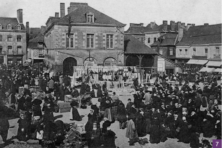
7. Carte postale de la place de l'église un jour de foire

Une cité commerçante : activité d'hier et d'aujourd'hui