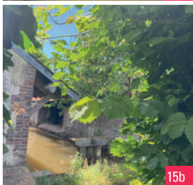
14. Maisons en pan de bois / 15a et 15b. Le lavoir

peintures murales (13b). Des thèmes variés témoignent de l'iconographie du Moyen-Age, laissant la part belle aux anges et démons. Le petit cimetière abrite notamment la tombe de Michel Jobert qui fut Secrétaire général de l'Elysée puis ministre sous Georges Pompidou et François Mitterrand. Le sentier Saint-Hubert permet de rejoindre la chapelle située à cinq kilomètres du centre.