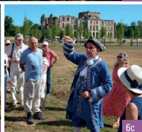
6a. Projection du château de Laborde / 6b. Le château au Moyen-Âge / 6c. Visites théâtralisées devant le château