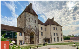
7. La Ferté-Vidame, la Maison Saint-Simon / 8. Senonches, cueillette / 9. Senonches, le château