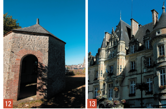
12. Sées / 13. Bagnoles-de-l'Orne

Toutes les balades peuvent être suivies en famille. Elles se terminent par une dégustation de produits du terroir. Certains sites ne sont pas accessibles aux personnes à mobilité réduite. Les parcours - de 1 à 4 km - se limitent au centre-bourg ou aux environs immédiats. Les visites sont gratuites. Certaines visites se font sur réservation.