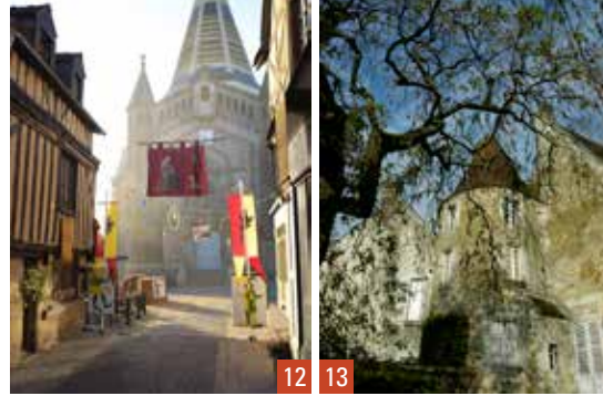
12. Domfront / 13. Mortagne-au-Perche

📍 15h, sur réservation : communication@sees.fr / 02 33 81 79 72 🏠 Mairie - 02 33 81 79 72