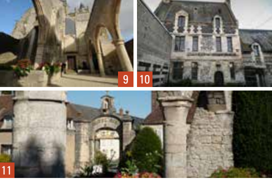
9. Ecouché / 10. Touques / 11. Sées

Petites Cités de Caractère® de Orne-Normandie