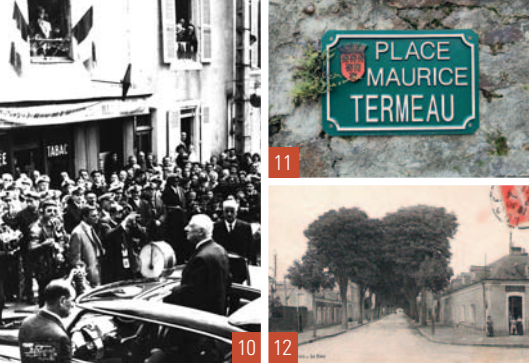
10 & 11. Sillé-le-Guillaume / 12. Le Lude