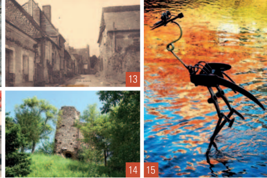
13 & 14. Saint-Calais / 15. Asnières-sur-Vègre